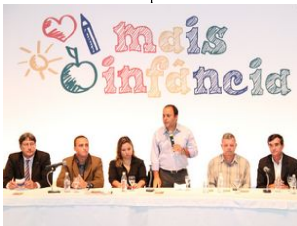
Figura 10 - Evento de lançamento do programa “Mais Infância” no município de Niterói