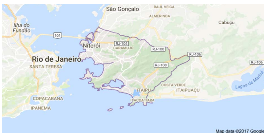
Figura 1 - Mapa da Cidade de Niterói