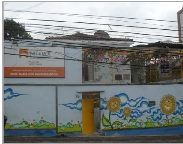
Figura 6 - UMEI Maria José Mansur Barbosa

Fonte: Disponível em: < https://pt-br.facebook.com/UMEI-Professora-Maria-Jos%C3%A9-Mansur-Barbosa-817996821574163/ >. Acesso em: 18 jan 2018.