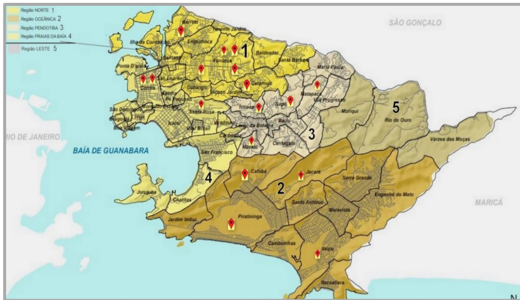
Figura 5 - Mapa da expansão da Educação Infantil realizada pelo Programa Mais Infância