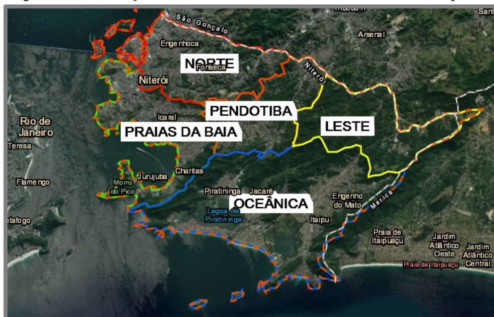
Figura 4 - Localização e divisão administrativa dos bairros do município de Niterói