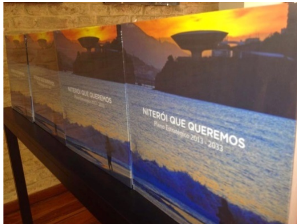
Figura 2 - Plano Estratégico Niterói que Queremos