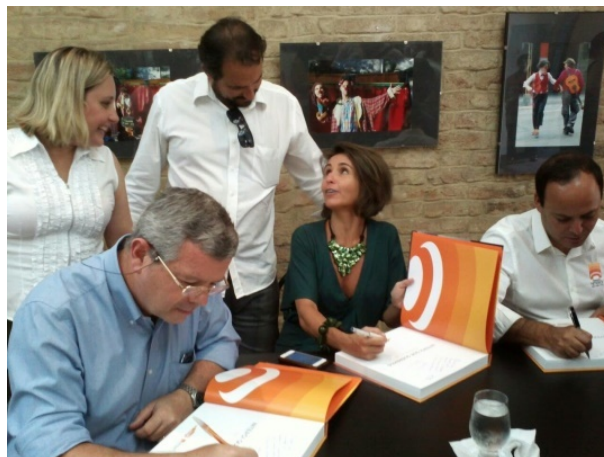
Figura 3 – Cerimônia de lançamento do Plano Estratégico NQQ