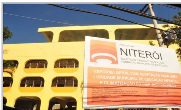
Figura 7 - UMEI Jacy Pacheco