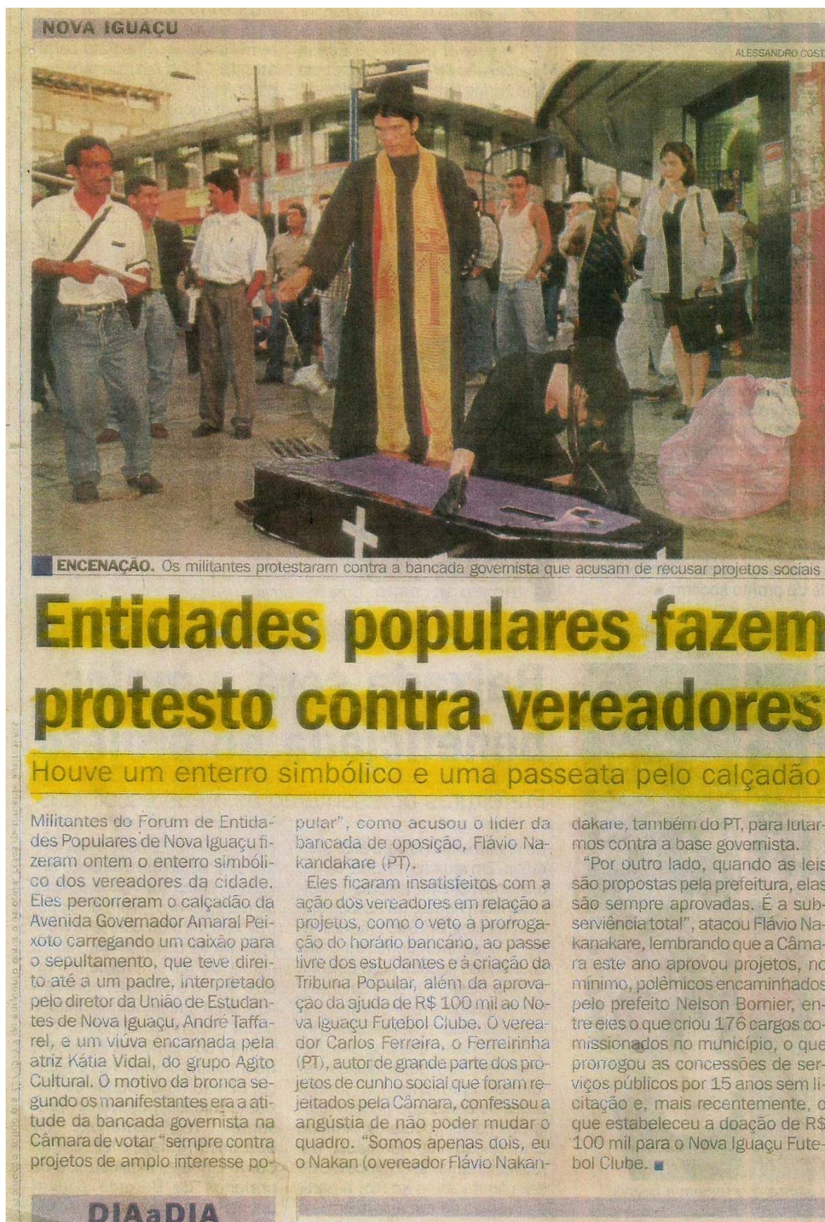
Figura 139 - Jornal O Dia, divulgação do ato contra os vereadores de Nova Iguaçu