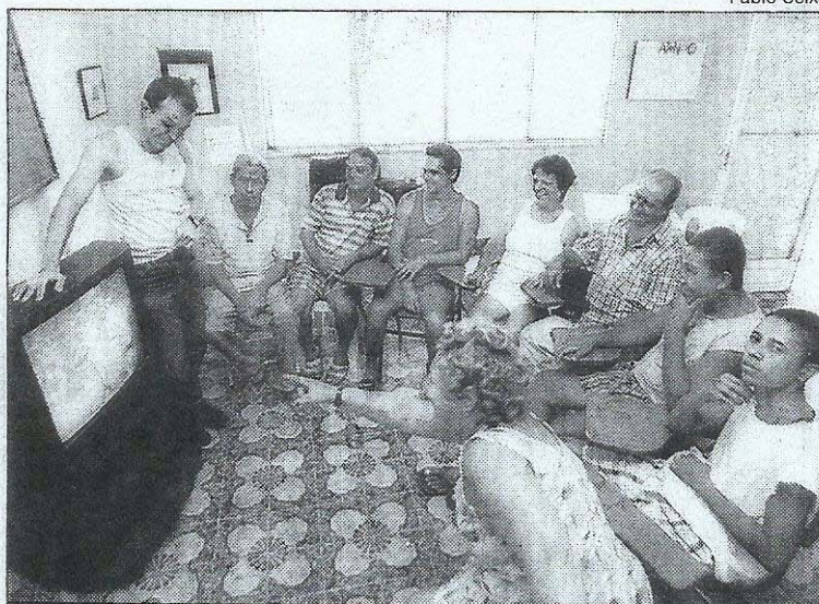
CURSO DE ALFABETIZAÇÃO: as aulas acontecem de segunda a sexta

— As provas são feitas por módulos e realizadas na Escola Federal de Química, que fornece o certificado de conclusão