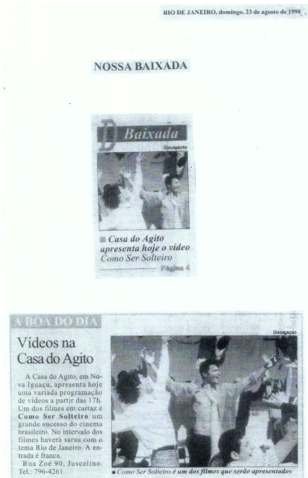
Figura 135 - Jornal O Dia, divulgação da exibição do filme “Como ser Solteiro” na Casa do Agito