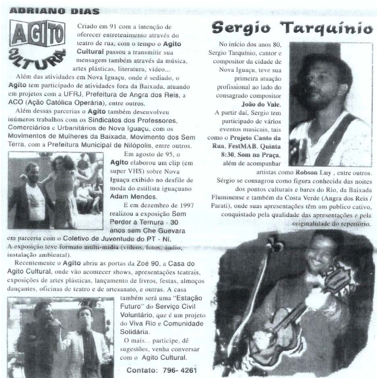
Figura 138 - Jornal Com Causa, matéria sobre o Agito Cultural