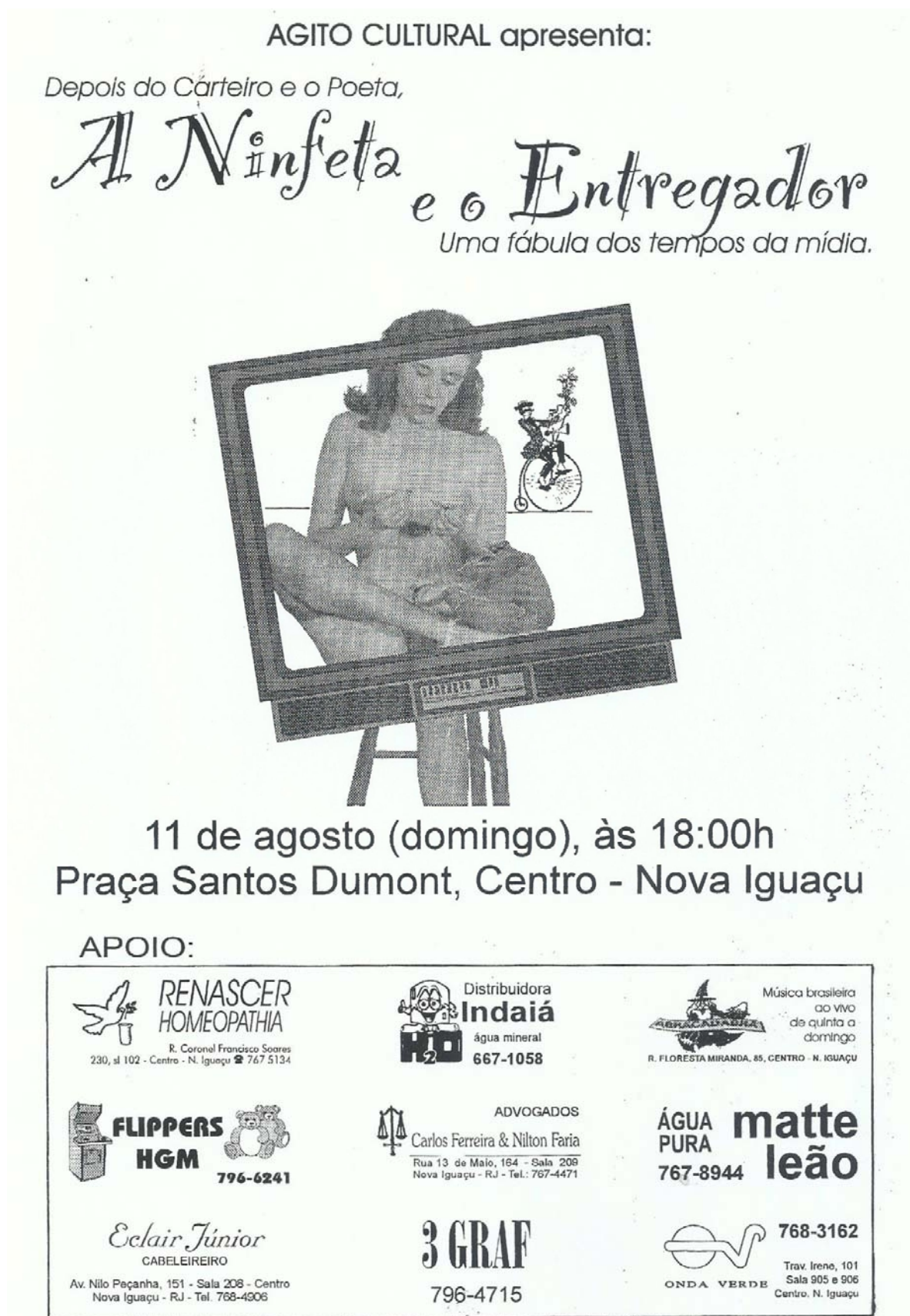
Figura 143 - Panfleto de divulgação da peça “A Ninfeta e o Entregador”