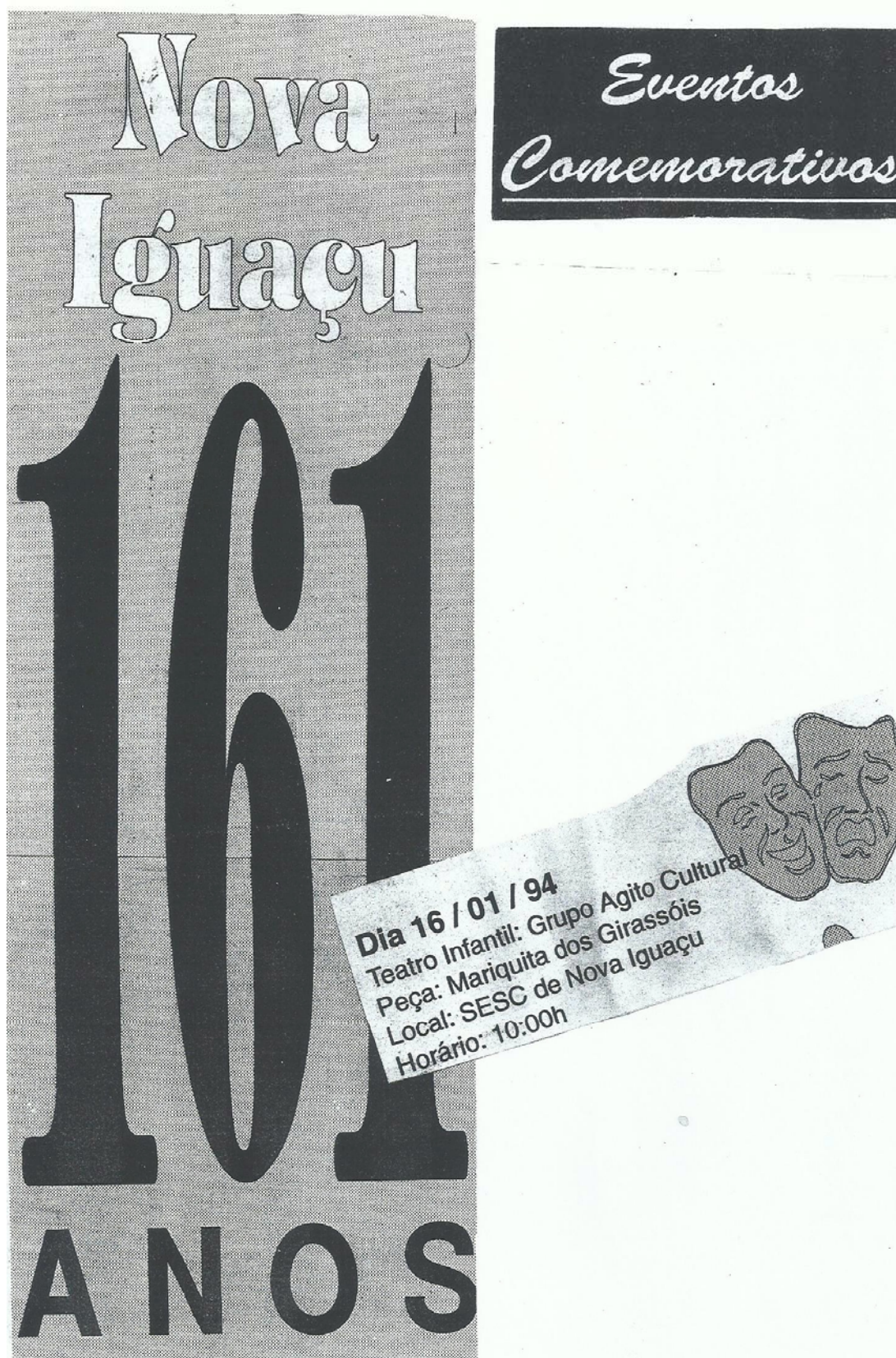
Figura 141 - Jornal de divulgação da programação de comemoração do aniversário de 161 de Nova Iguaçu