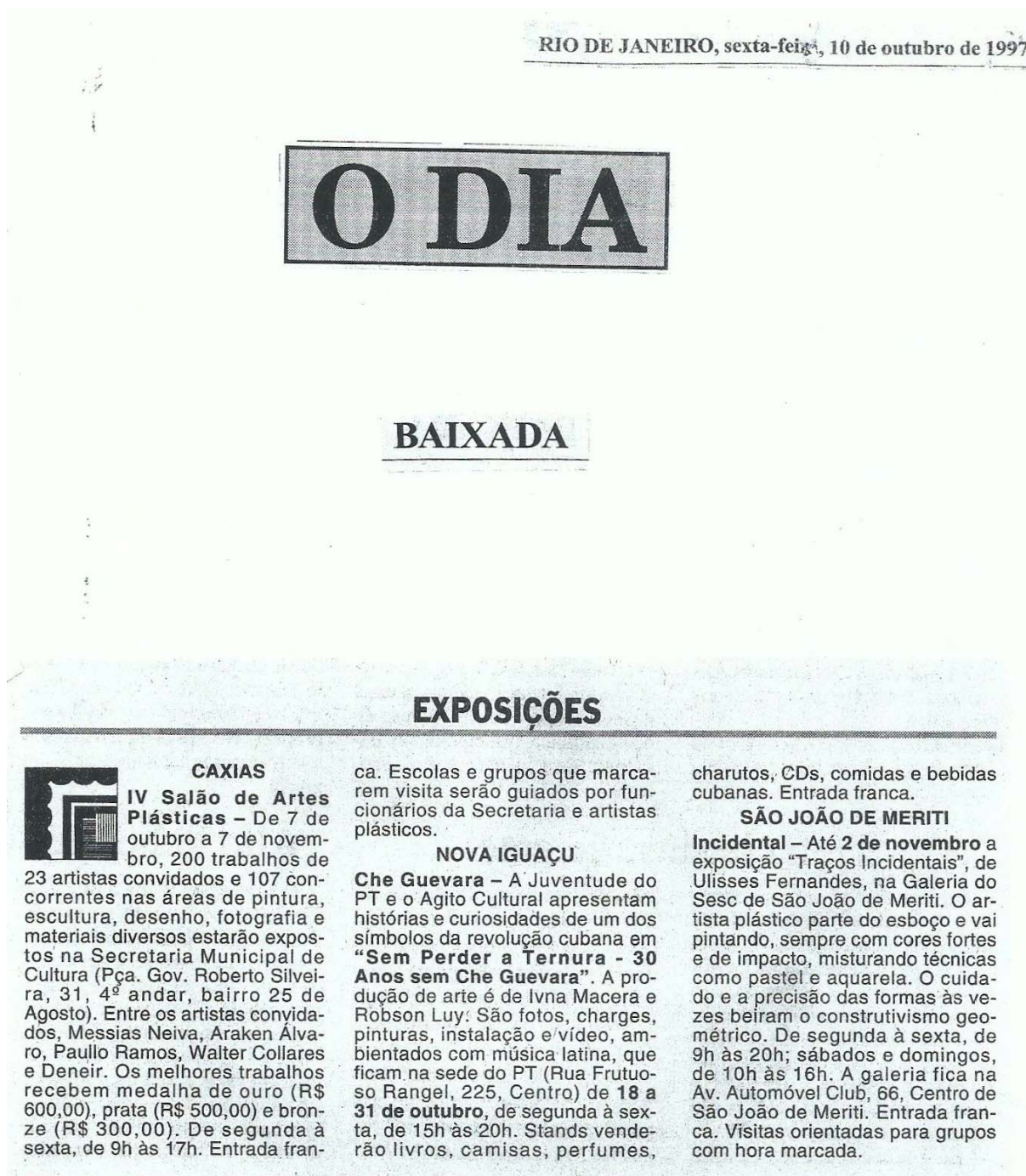
Figura 111 - Jornal O Dia, divulgação da Exposição Che Guevara