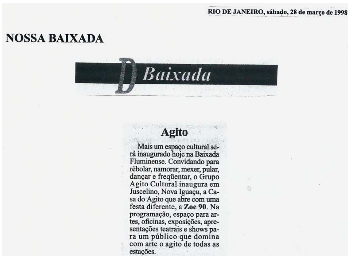
Figura 116 - Jornal O Dia, divulgação da inauguração da Casa do Agito