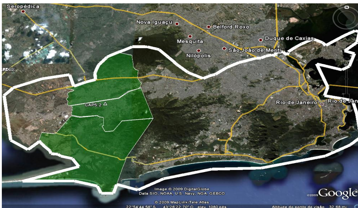
Mapa - Localização da AP 5.2 em relação ao município do Rio de Janeiro

(865.089). Campo Grande e Guaratiba se configuram como os dois maiores bairros da AP 5.2 e serão brevemente caracterizados a seguir.