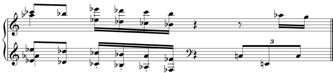
Figura 2 – Escala de tons inteiros.