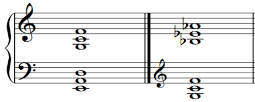
Figura 3 – Acordes criados pela superposição de quartas.

Fonte: SCHOENBERG, Primeira Sinfonia de Câmara, opus 9 (cc.368 e 373).