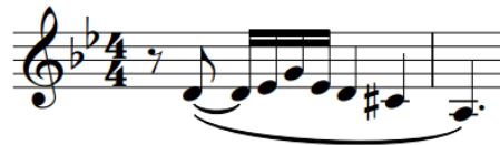
Figura 17 – Variação motívica dos exemplos 9 e 10.

Fonte: SCHOENBERG, Kol Nidre , opus 39 (c. 18).