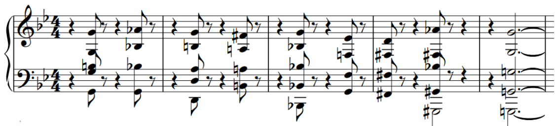
Figura 21 – Construção harmônica do acompanhamento do tema.

Fonte: SCHOENBERG, Kol Nidre , opus 39 (cc. 58-61).