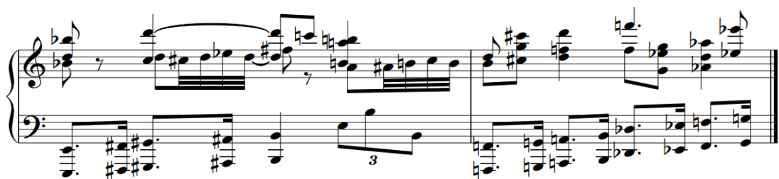
Figura 1 – Escala de tons inteiros.

Fonte: SCHOENBERG, Primeira Sinfonia de Câmara , opus 9 (cc. 232 e 233).