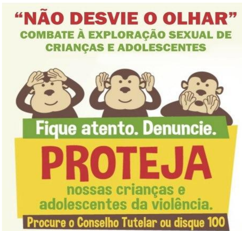
Figura 3 – Campanha “NÃO DESVIE O OLHAR”