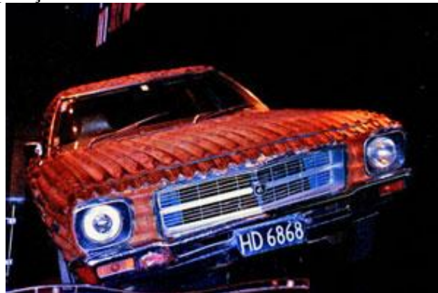
Figura 3 - Car, em exposição na Nova Zelândia