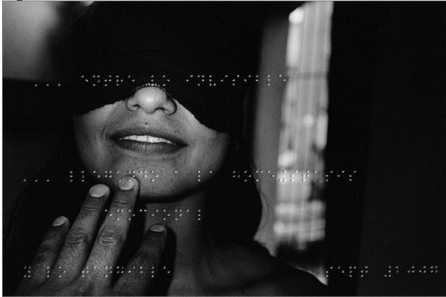
Figura 7 – Desnudos