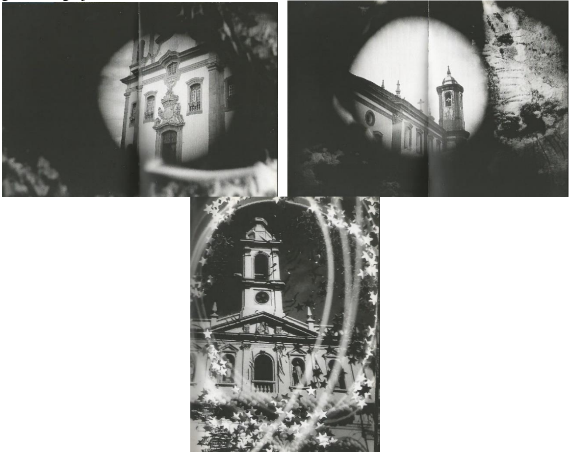
Figura 1 – Igrejas em Ouro Preto

Legenda: fotos de Igrejas em Ouro Preto “da série Memória do Brasil” de Evgen Bavcar. Fonte: BAVCAR; TESSLER; BANDEIRA, 2003.