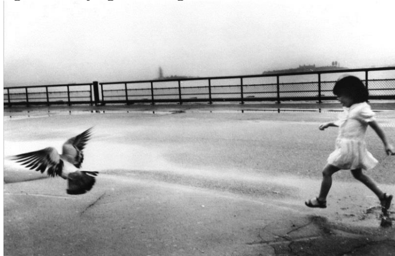
Figura 5 – Trying their wings