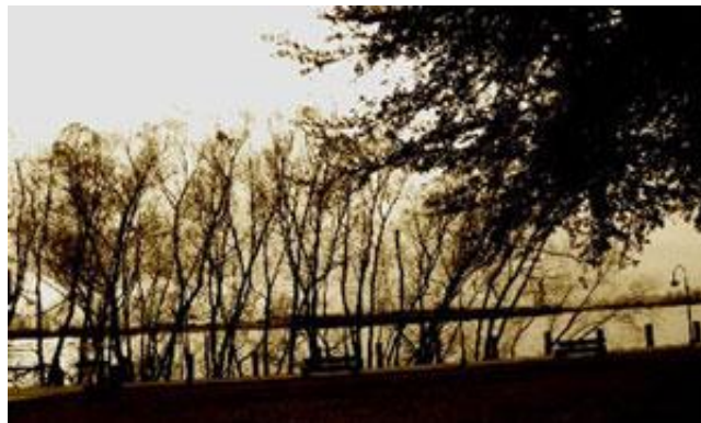
Figura 2 – The Mississippi River, Audubon Park, Nova Orleans

Essas palavras mostram outro olhar sobre o que é e como fazer fotografia. Essa multiplicidade é possível porque a fotografia abrange diferentes tipos de prática, e é o fotógrafo quem vai colocar o seu olhar, seus sentimentos e pensar a sua fotografia. A seguir, alguns exemplos do trabalho de Butler.