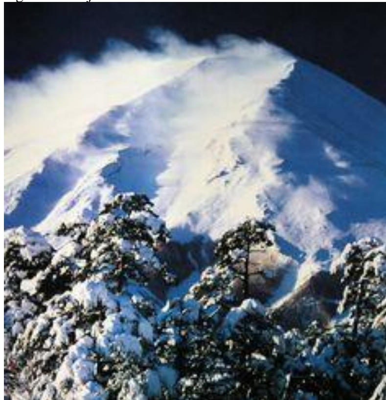
Figura 6 – Fuji San