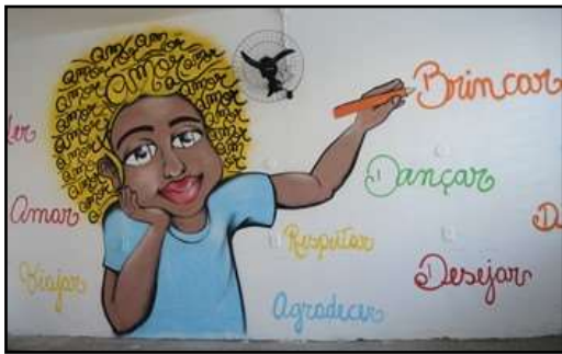
Figura 1- Mural feito por um coletivo de meninas grafiteiras