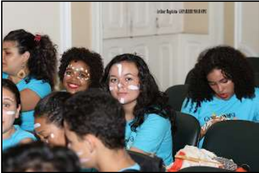
Figura 5- Alunos no seminário do GEPARREI