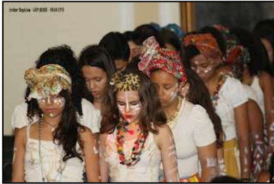
Figura 8 - Apresentação de alunos no seminário do GEPARREI