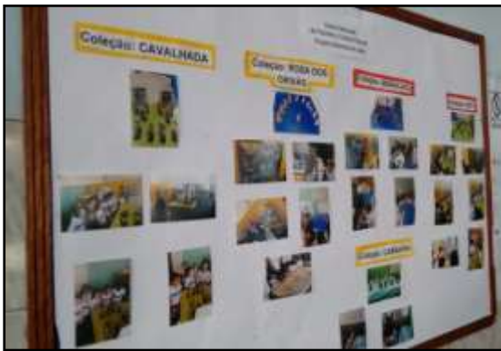
Figura 2- Mural de fotos de atividades realizadas pelos alunos do Neab Ayó