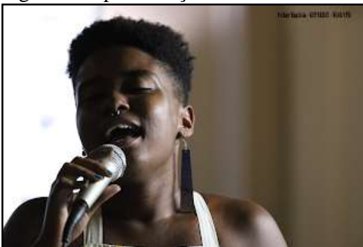
Figura 7- Apresentação no seminário do GEPARREI