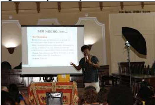
Figura 6 - Apresentação no seminário do GEPARREI