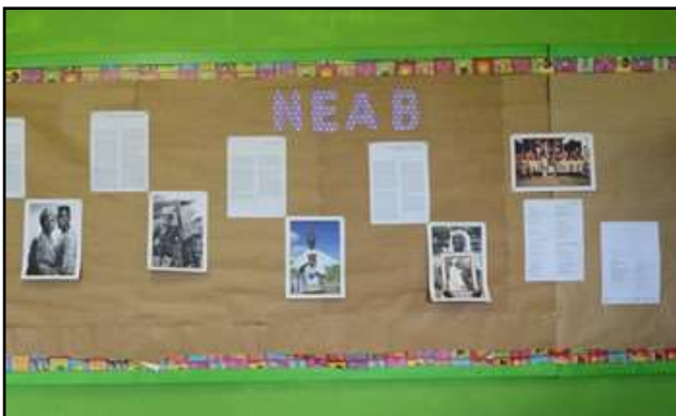
Figura 3- Painei da sala cedida ao Neab Ayó