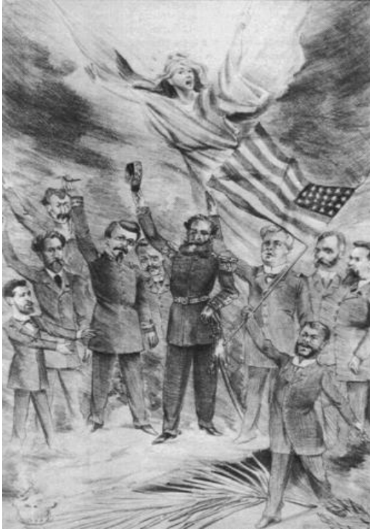
Figura 4 – José do Patrocínio comemora a Proclamação da República