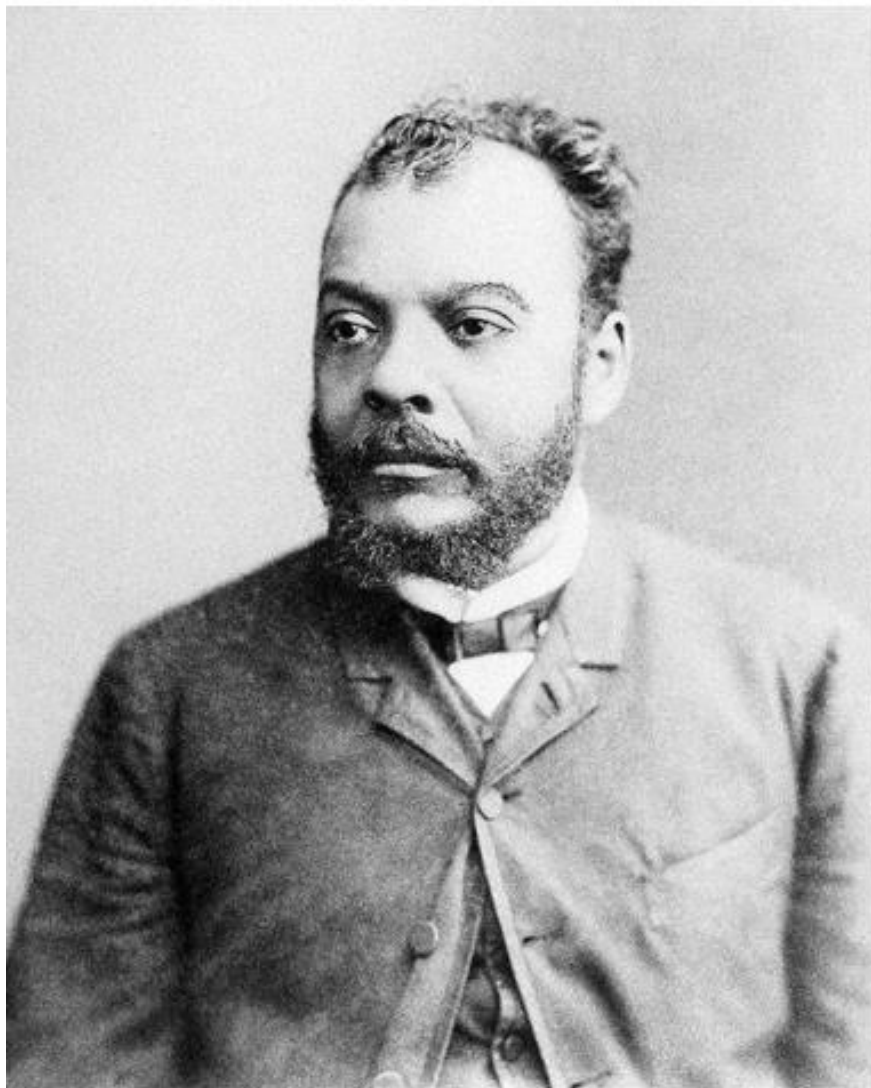
Figura 1 - José do Patrocínio (1853-1905)