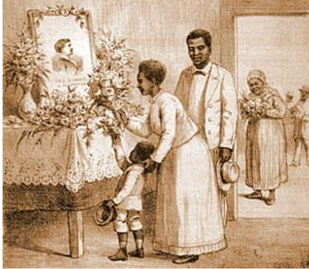
Figura 2 - Criança sendo ensinada pelos pais a agradecer a princesa Isabel