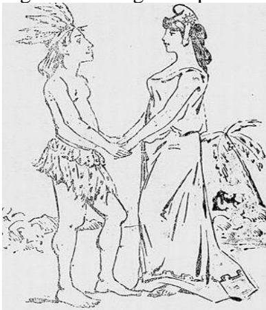
Figura 3 – Índigena representando o Brasil segurando as mãos da República