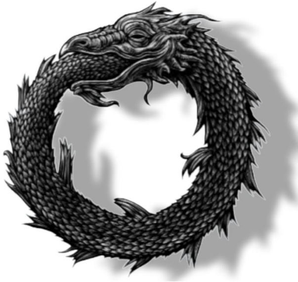
Figura 1- Ouroboros