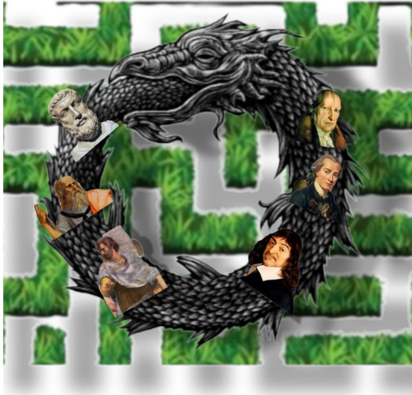
Figura 2 - Ouroboros Filosófico