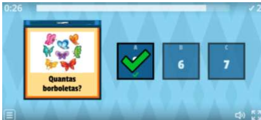
Figura 3 – Jogo “Vamos contar!”