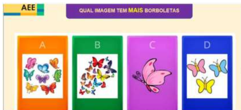
Figura 2 - Atividade de contagem. Novembro/2021