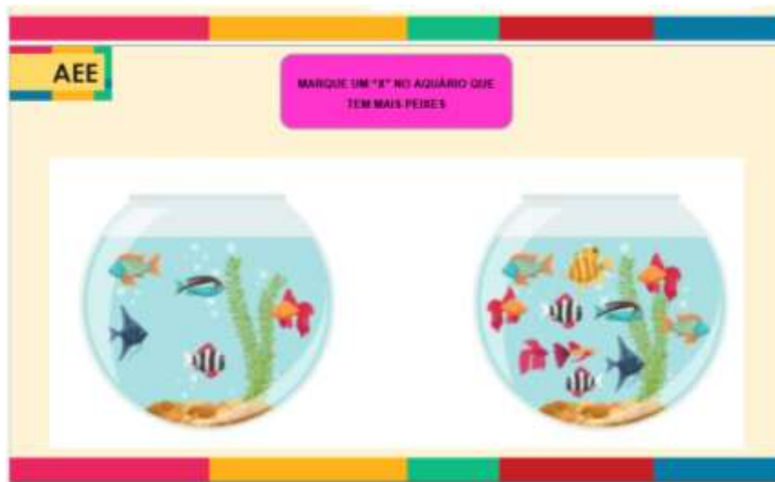
Figura 5 – Atividade de comparação de quantidade, novembro/2021