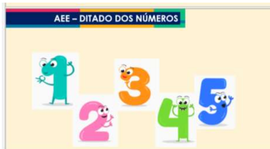
Figura 4 – Atividade do Livreto, agosto/2021