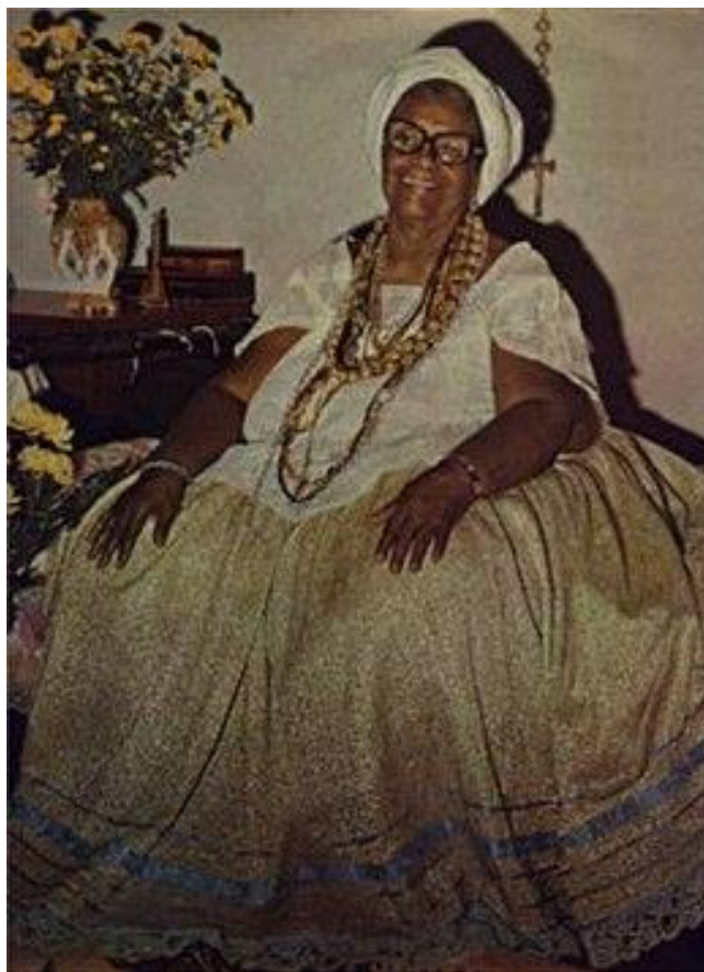
Figura 30 - Mãe Menininha do Gantois

O axé da Bahia me chamou É lá no Bonfim que eu vou rezar Pedir proteção de Pai Xangô Na casa da Mãe do Gantois