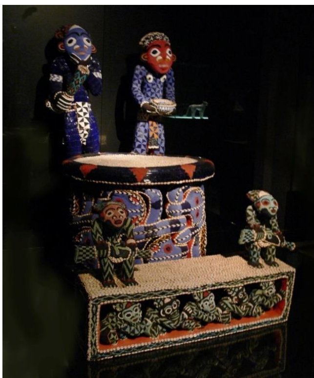
Figura 25 – Trono que pertenceu a Ibrahim Njoya, rei de Bamum, no século XX