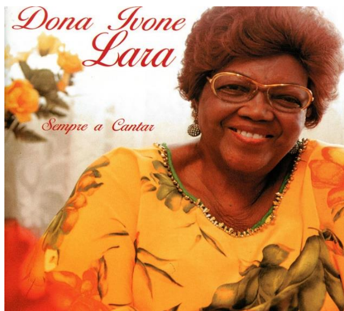
Figura 12 – Capa do 8º disco