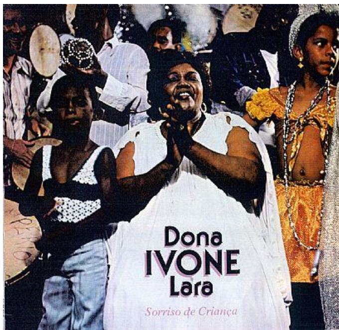
Figura 6 – Capa do 2º disco