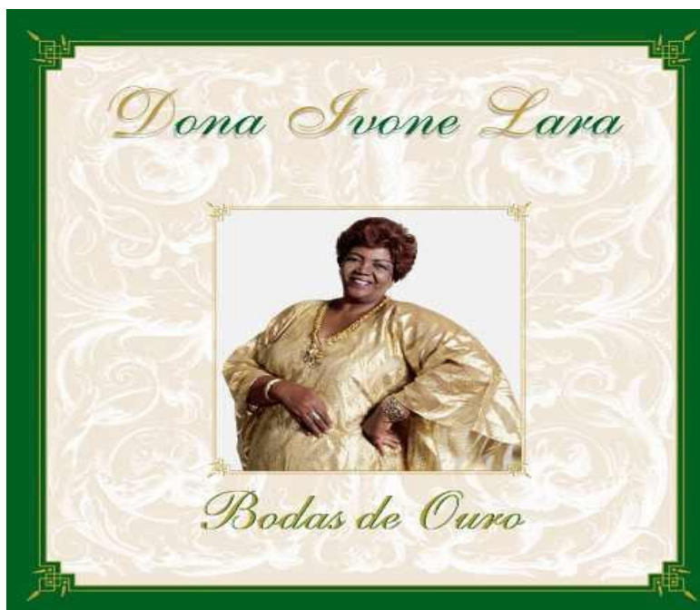
Figura 10 – Capa do 6º disco