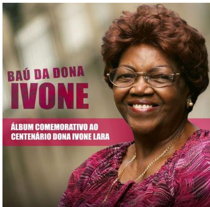
Figura 16 – Capa do 12º disco