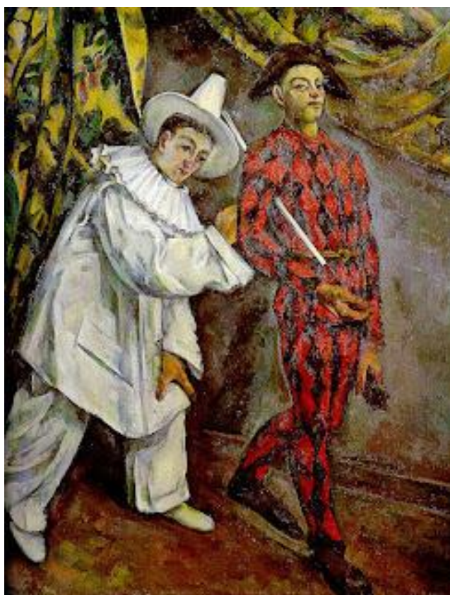
Figura 18, Pierrot et Arlequin, Paul Cézanne, 1888