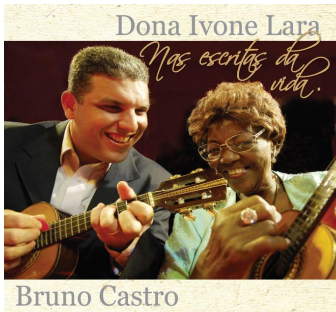
Figura 14 – Capa do 10º disco