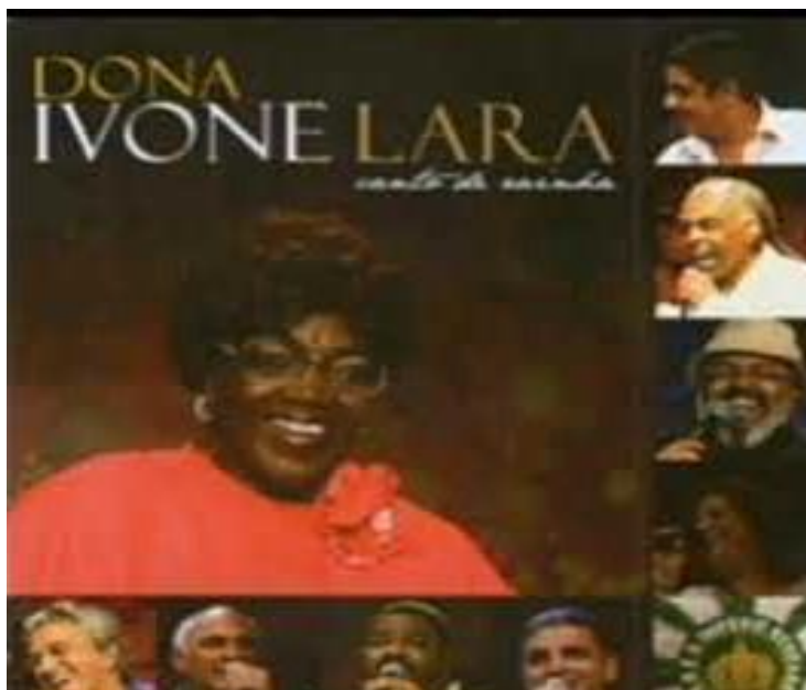
Figura 13 – Capa do 9º disco