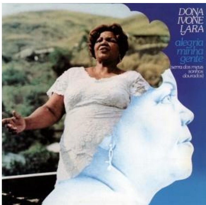
Figura 8 – Capa do 4º disco