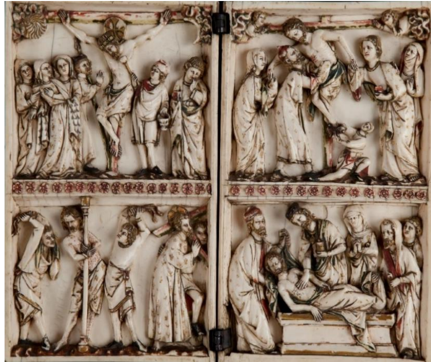
Figura 24 - um díptico em marfim encenando a Paixão de Cristo

inscritos nos dípticos ou nos libri memoriales dizem todas aproximadamente a mesma coisa: ‘ Quorum quarumque recolimus memoriam ’ - ‘aqueles ou aquelas cuja memória lembramos’” (LE GOFF, 1990, p.386).