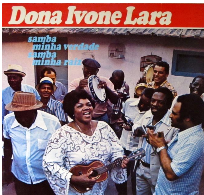
Figura 5 – Capa do 1º disco