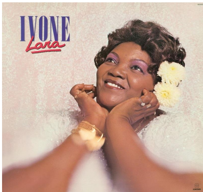
Figura 9 – Capa do 5º disco