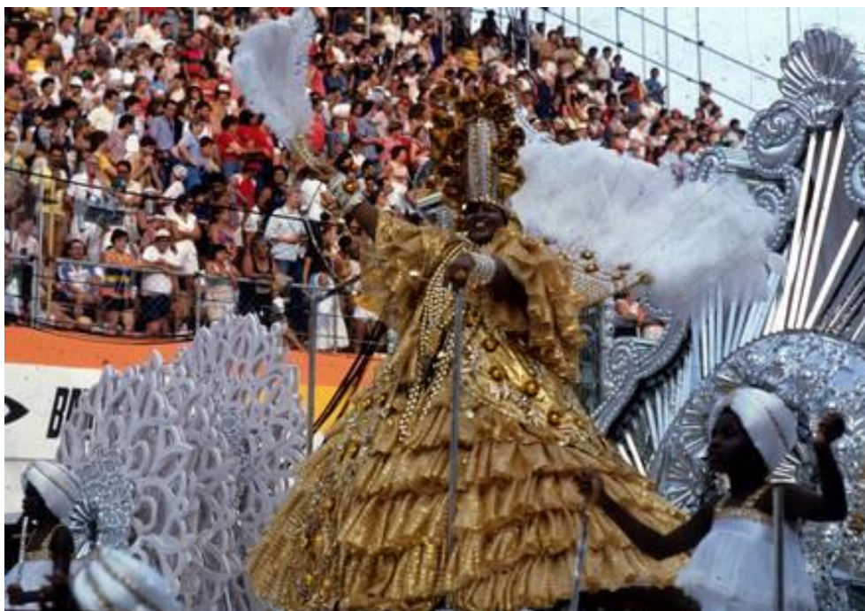
Figura 4 – Dona Ivone Lara em “Mãe baiana mãe”, no desfile de 1993, do Império Serrano