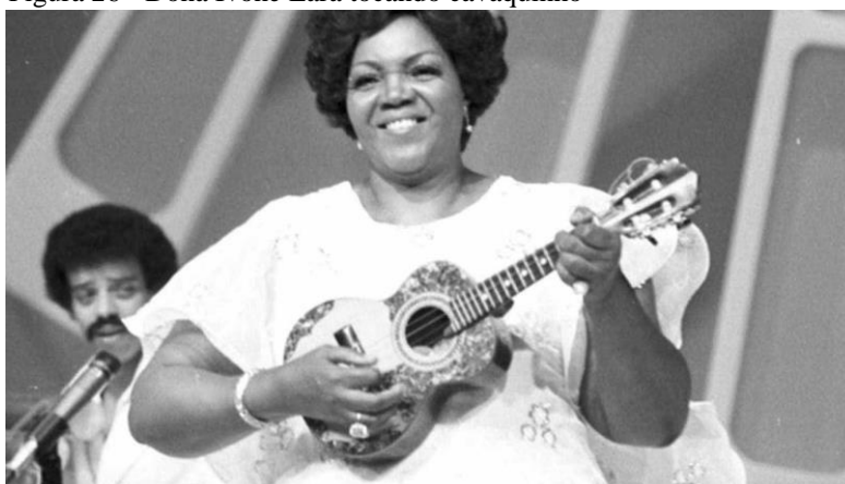
Figura 26 - Dona Ivone Lara tocando cavaquinho