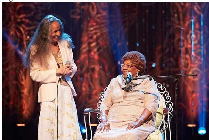
Figura 33 - Dona Ivone Lara e Maria Bethânia