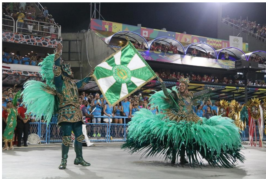
Figura 32 - Mestre-sala e Porta-bandeira do Império Serrano

carioca, renovadas a cada ano, as primeiras, até talvez a década de 1950, continham informações sobre o enredo que apresentavam. Daí em diante, provavelmente, pelo fato de terem deixado de ser confeccionadas artesanalmente, ganharam, como regra geral, uma forma padronizada, que remete à “bandeira do sol nascente”, pavilhão militar do Japão, banido em 1952 e readotado em 1954. Acrescente-se que, nas escolas, o costume da renovação anual da bandeira permanece, sendo a do ano anterior empunhada pela segunda porta-bandeira (LOPES; SIMAS, 2015, p. 32).