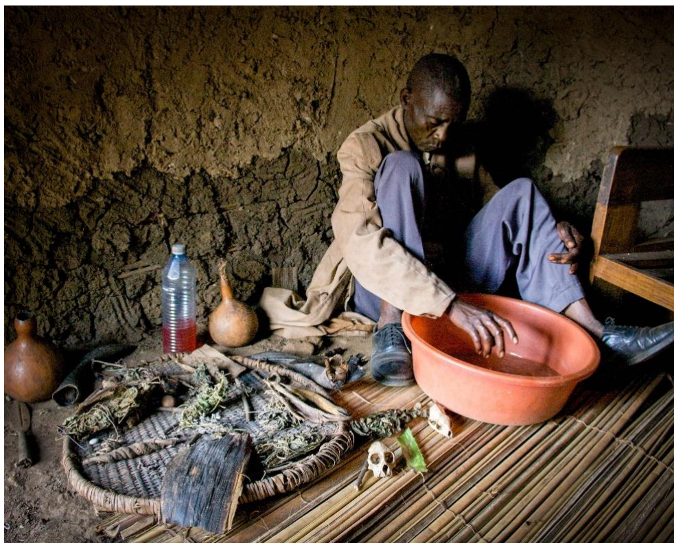
Fonte: Revista Galileu, 27/06/2020