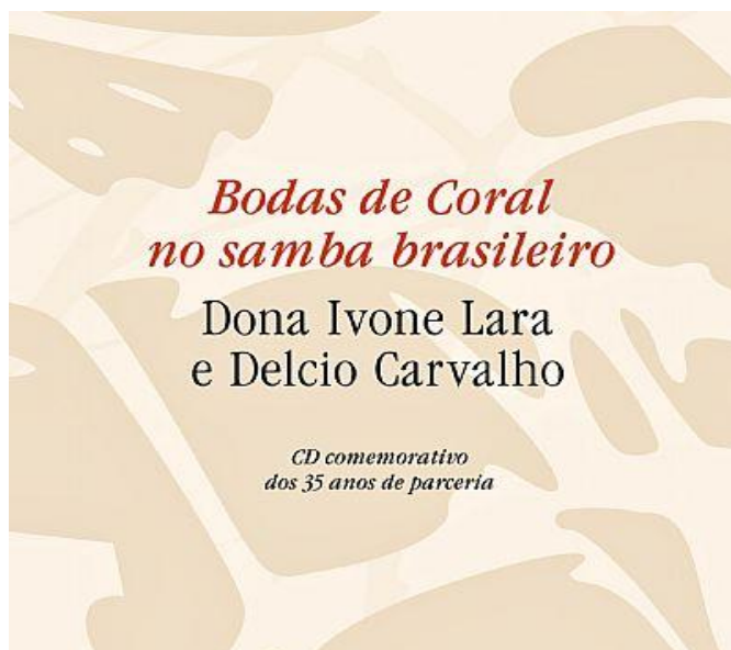
Figura 15 – Capa do 11º disco