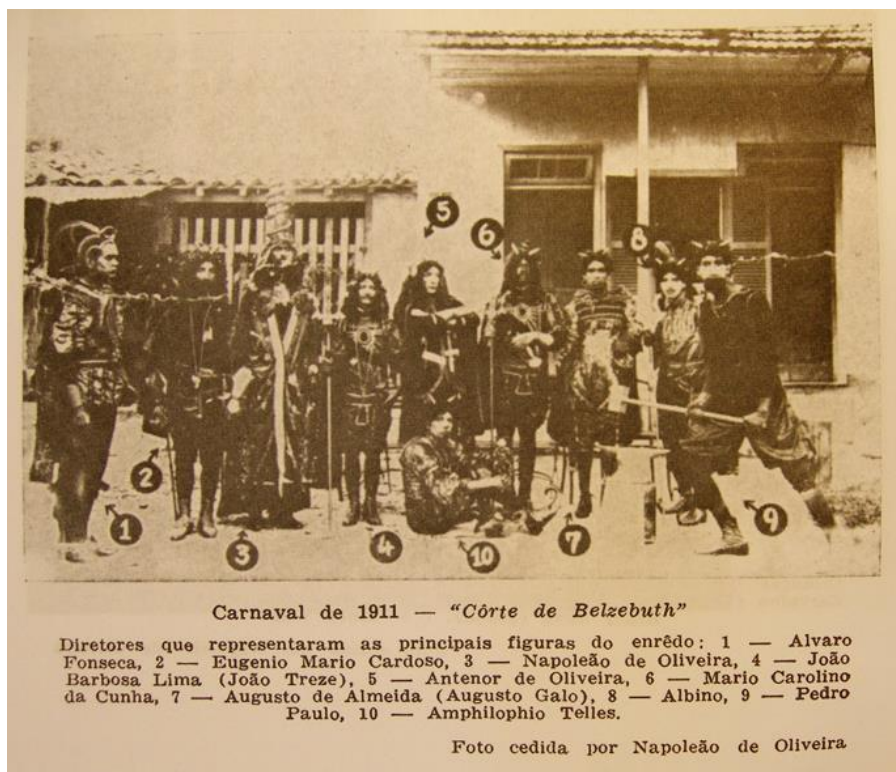
Figura 21 – Rancho-escola Ameno Resedá desfilando nos jardins do Palácio da Guanabara, com o enredo “A Corte de Belzebu”

Legenda: EFEGÊ, Jota. Ameno Resedá: o rancho que foi escola. Documentário do carnaval carioca. Rio de Janeiro: FUNARTE, 2009.