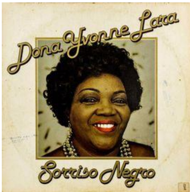
Figura 7 – Capa do 3º disco