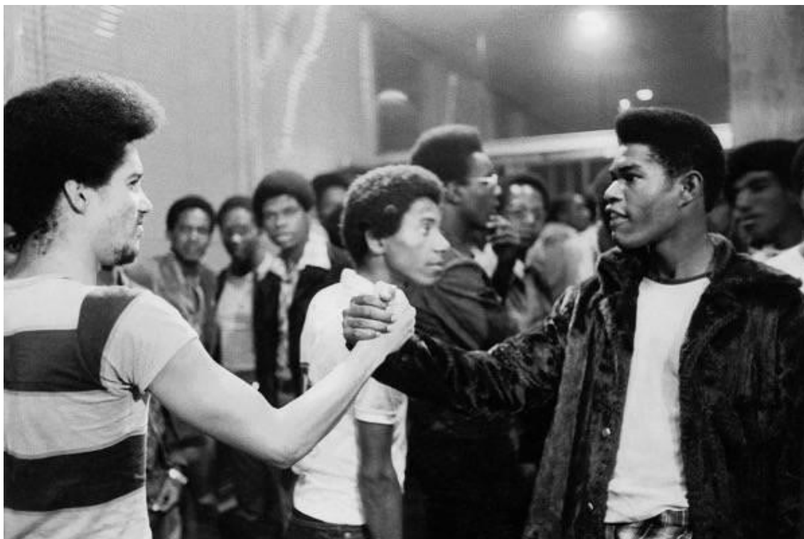
Figura 3 - Dois homens se cumprimentando na entrada do baile soul