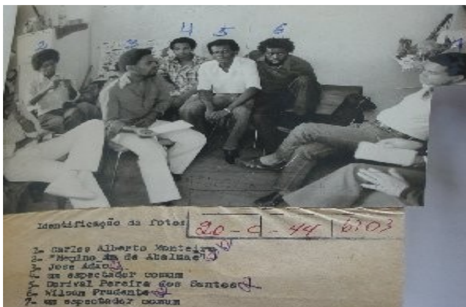
Figura 8 - Reunião de militantes do MNUCDR com identificação dos militantes pela polícia, em 1979

Fonte: Acervo DEOPSSP. Reproduzido de: KOSSLING, op. cit. p 46.