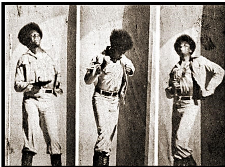
Figura 1 - Tony Tornado no V FIC em 1970