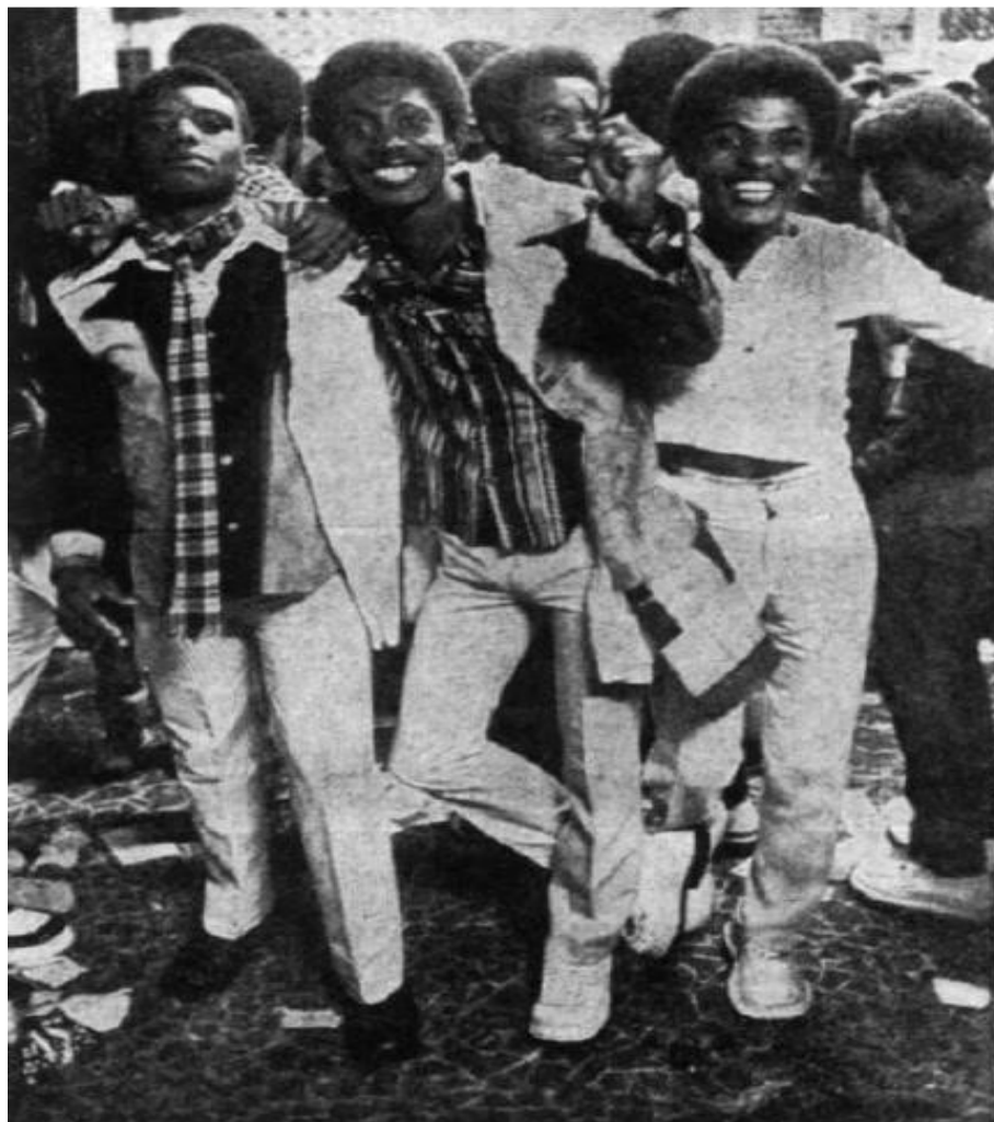
Figura 5 - Jovens frequentadores dos bailes vestidos no estilo soul