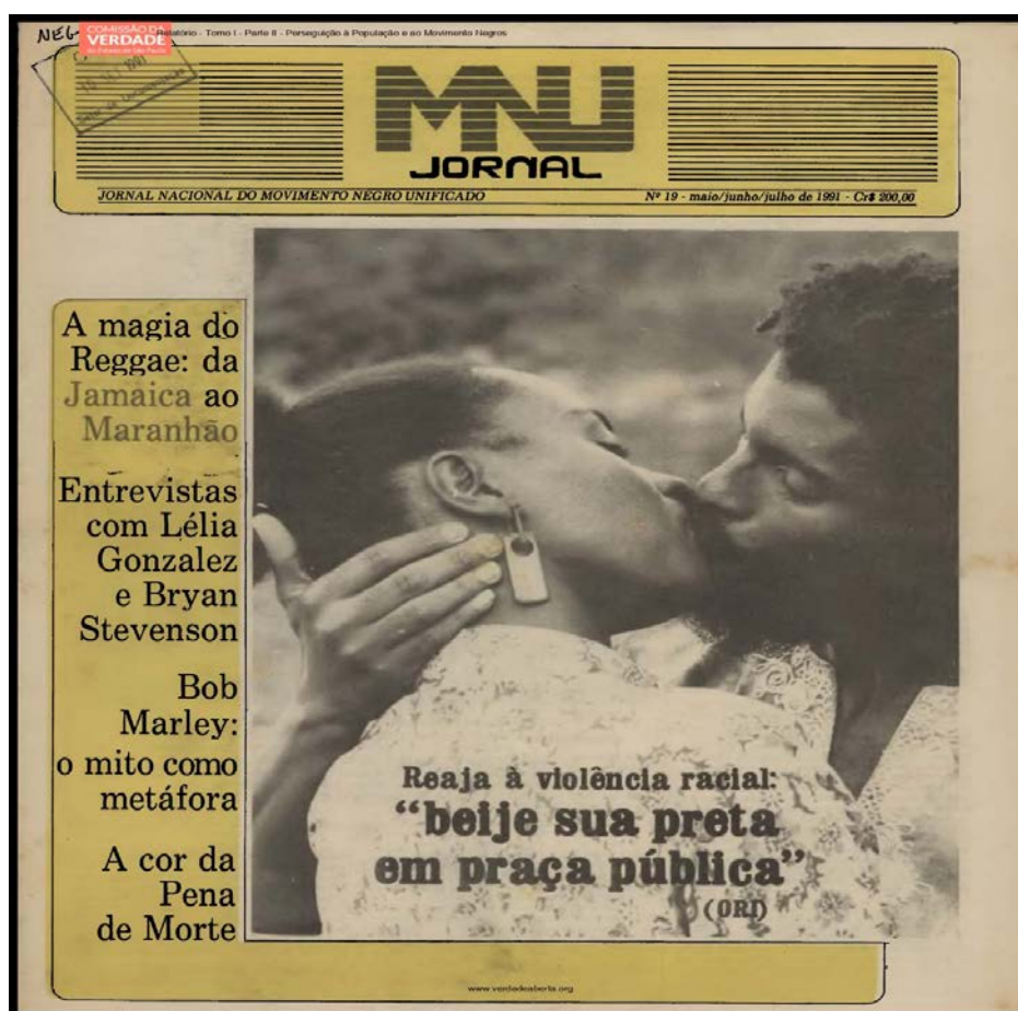
Figura 12 - Jornal Nacional do Movimento Negro Unificado. Nº 19. maio, junho e julho de 1991