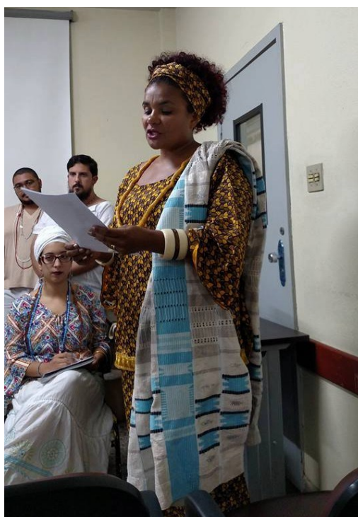
Figura 13 - Leitura do Manifesto de Fundação do Movimento Axé Pela Democracia

Em 2018 o Movimento Axé pela Democracia coordenou junto a movimentos sociais de luta pela liberdade religiosa do Rio de Janeiro uma série de plenárias unificadas tendo como pauta a construção de um programa político a ser entregue aos candidatos das eleições ocorridas em outubro do referido ano.