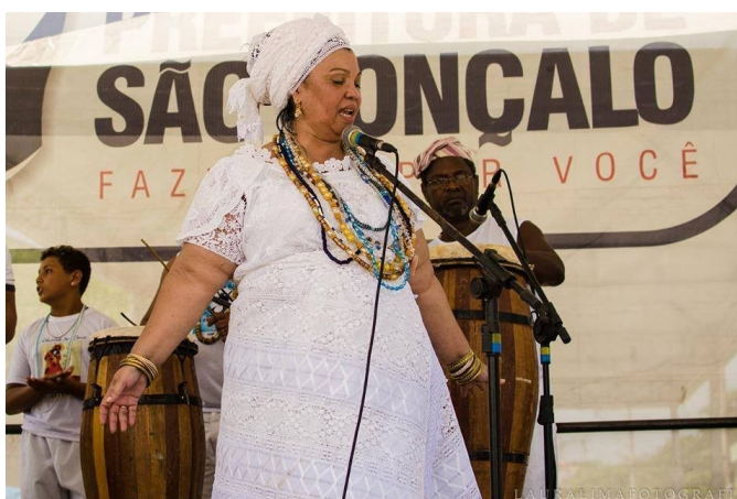
Figura 12 - 8º Presente de Iemanjá em São Gonçalo

Fonte: Fotografia de Laura Lima, fevereiro de 2015.