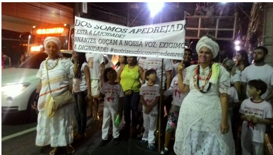
Figura 14 – Primeira Caminhada dos Povos e Comunidades de Matriz Africana de São Gonçalo