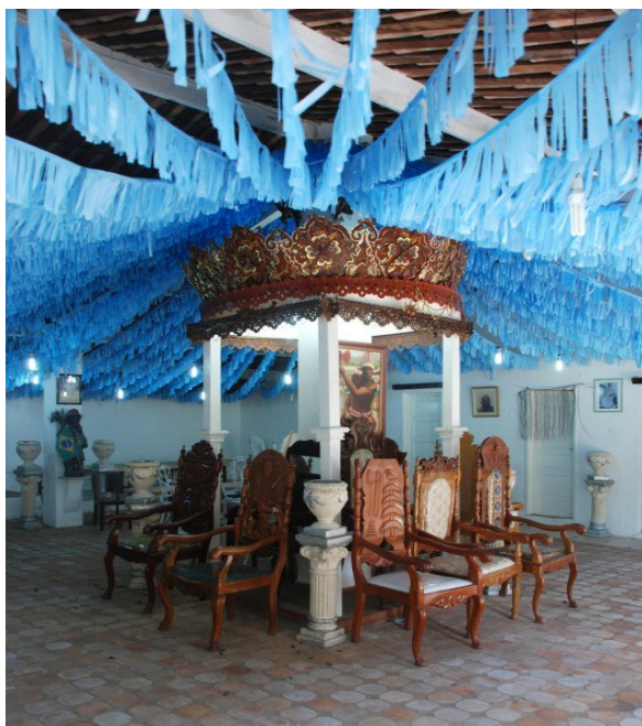
Figura 2 - Coroa de Xangô da Casa Branca