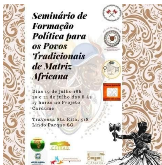
Figura 15 - Divulgação do Seminário de Formação Política para Povos Tradicionais de Matriz Africana

Em 2019, o COMIRSG, com representação majoritária de terreiros da cidade, organizou o primeiro seminário de formação política para povos tradicionais de matrizes africanas, realizado no Projeto Cardume, em parceria com o Centro de Tradições Afro-Brasileiras.