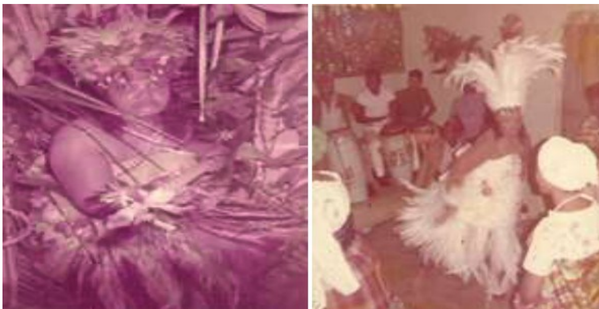
Figura 9 - Caboclo Tupã