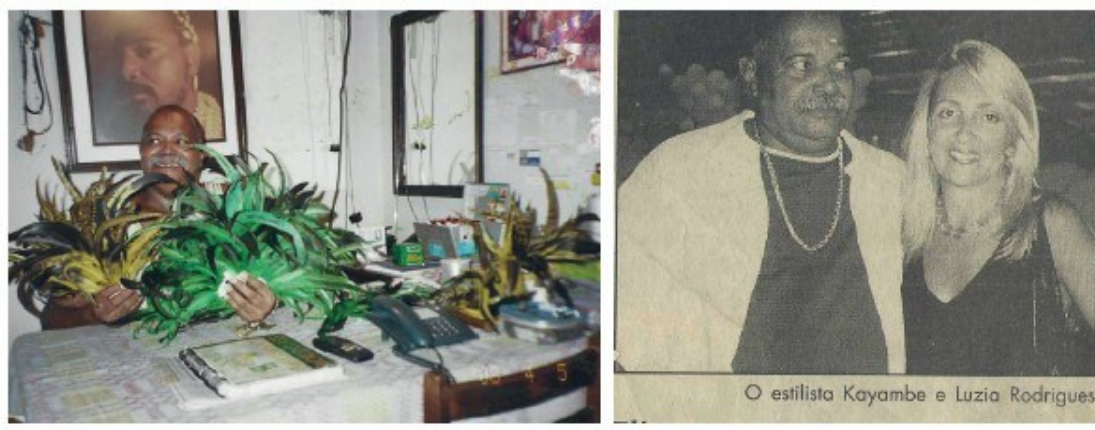
Figura 11 - Pai Kayambe de Ogun

Fonte: Acervo Ilê Asè do Ogun Já; Jornal O São Gonçalo ( apud REBELO 2022, p.70).