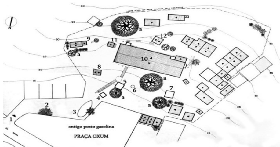
Figura 6 - Levantamento do Conjunto da Casa Branca