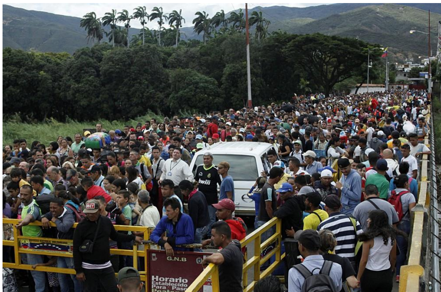
Figura 3 – Ponte em San Antonio del Táchira

Legenda: Ponte que liga San Antonio del Táchira, na Venezuela, a Villa Del Rosario, do lado colombiano, se tornou símbolo do êxodo de venezuelanos.