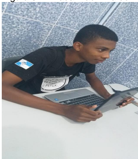
Figura 8 – A fada madrinha do Tour