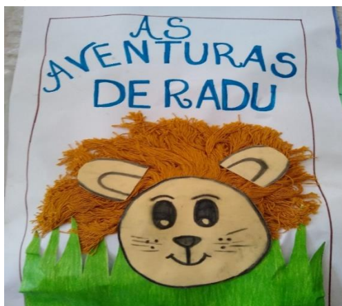
Figura 10 – As aventuras de Radu