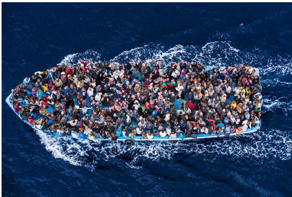
Figura 1 – Travessia do Mar Mediterrâneo

Legenda: Centenas de refugiados e migrantes a bordo de um barco de pesca momentos antes de serem resgatados pela Marinha italiana, como parte de sua operação Mare Nostrum, de junho de 2014.