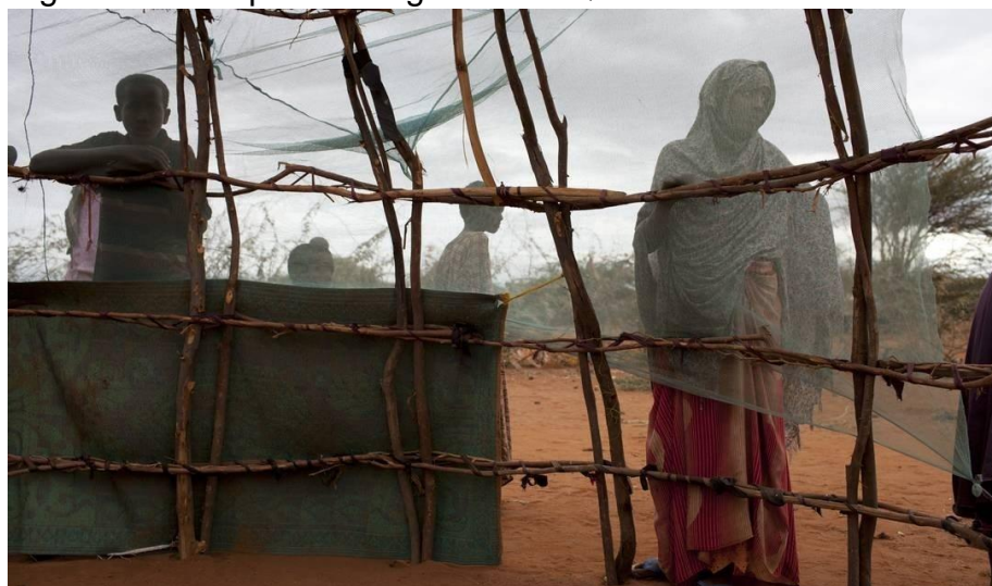
Figura 2 – Campo de refugiados no Quênia

Legenda: Refugiados da Somália no campo de Dadaab, no Quênia, em 2011.