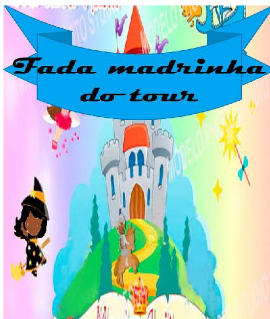
Figura 9 – A fada madrinha do Tour