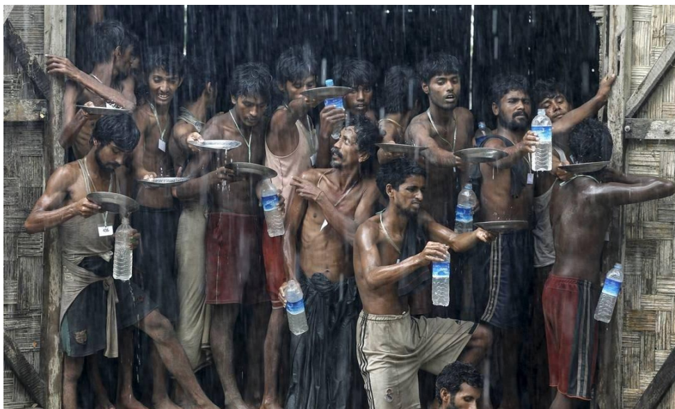
Figura 4 – Reduto de Imigrantes

Legenda: Grupo de migrantes resgatados de uma embarcação com 734 pessoas vindas de Mianmar; eles estavam no mar a mais de dois meses, com pouca água e comida.