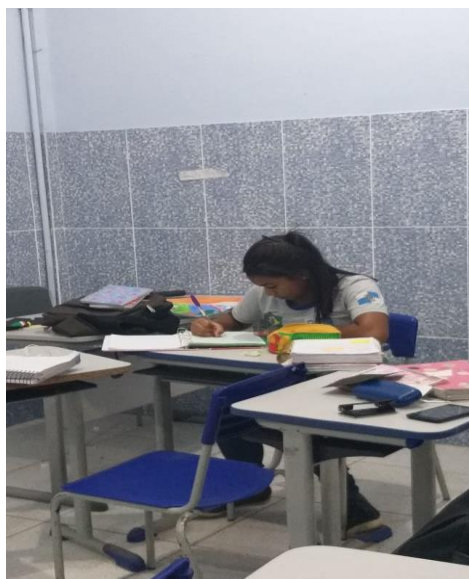
Figura 6 – As aventuras de Radu