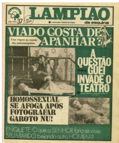
Figura 3 - Capa do Lampião: edição número trinta e sete (julho/1981)

jornal não conseguiria aumentar suas vendas. Em junho de 1981, o jornal publicaria a sua última edição, de número 37 (Figura 3).