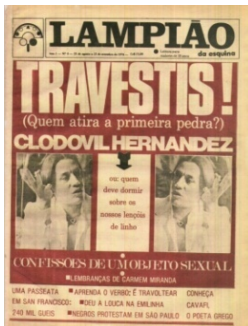
Figura 1 - Capa do Lampião: edição número quatro (agosto-setembro/1978)

O jornal também dedicaria atenção, em suas páginas, para as travestis. A edição nº 4 (agosto-setembro/1978) trouxe, estampada em sua capa, a manchete: “ Travestis! (quem atira a primeira pedra?) ” (Figura 1).