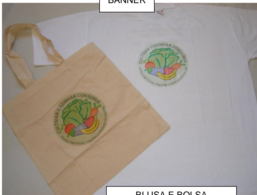
BLUSA E BOLSA