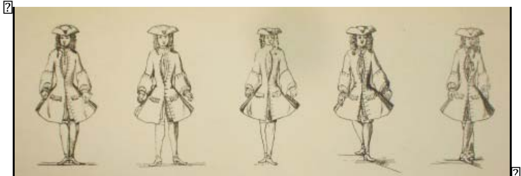
Figura 1 - As cinco posições dos pés do balé clássico.

Fonte: GINOT, Isabelle; MICHEL, Marcelle. La danse au XXe siècle. Larousse, Paris, 2002, p.13. Disponível em: < http://www.contemporary-dance.org/name-of-positions-for-floor-barre.html > Acesso em: 27 dez. 2015.