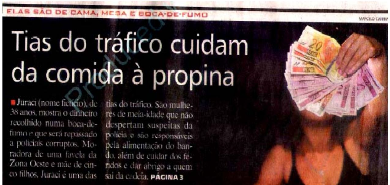
Jornal Extra 29 de outubro de 2007

No dia 30 de outubro de 2007 as “tias do tráfico” tiveram destaque na série. Mesmo com o espaço significativamente reduzido, o anúncio da série permanecia na primeira página. Mantendo o padrão explicativo, a reportagem detalhava as atividades que normalmente seriam atribuídas a essas personagens da rede de comércio de entorpecentes.