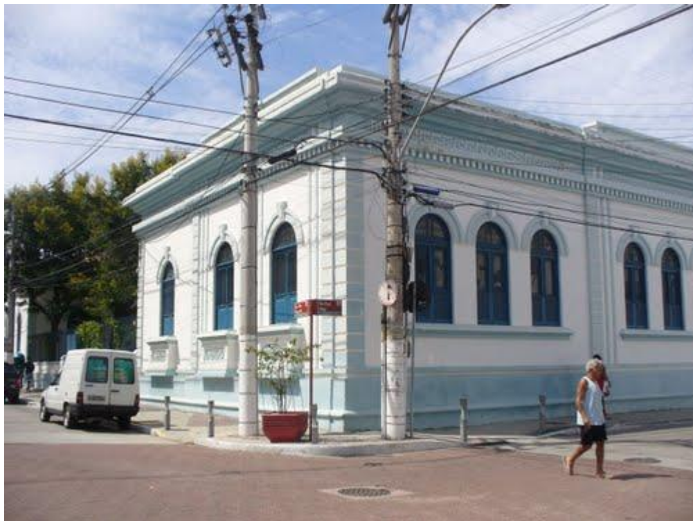
Escola Estadual Ismar Gomes, Cabo Frio.