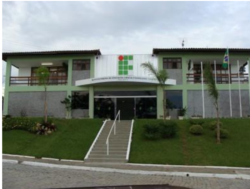
Instituto Federal Fluminense, Cabo Frio.