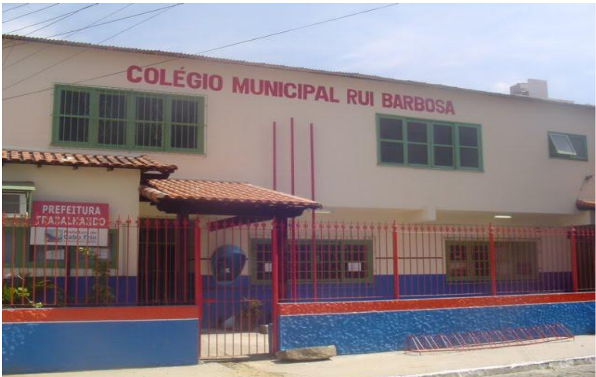
Escola Municipal de Ensino Médio Rui Barbosa, Cabo Frio.