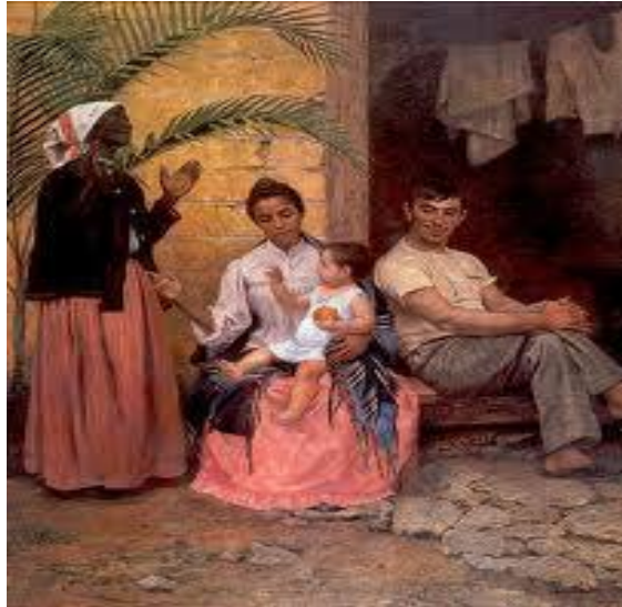
“Redenção de Can”, Modesto Bastos