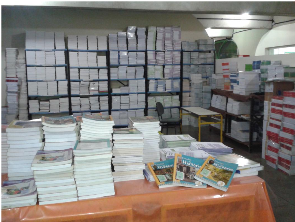
Livros escolhidos no PNLD 2012 e os que são realmente utilizados