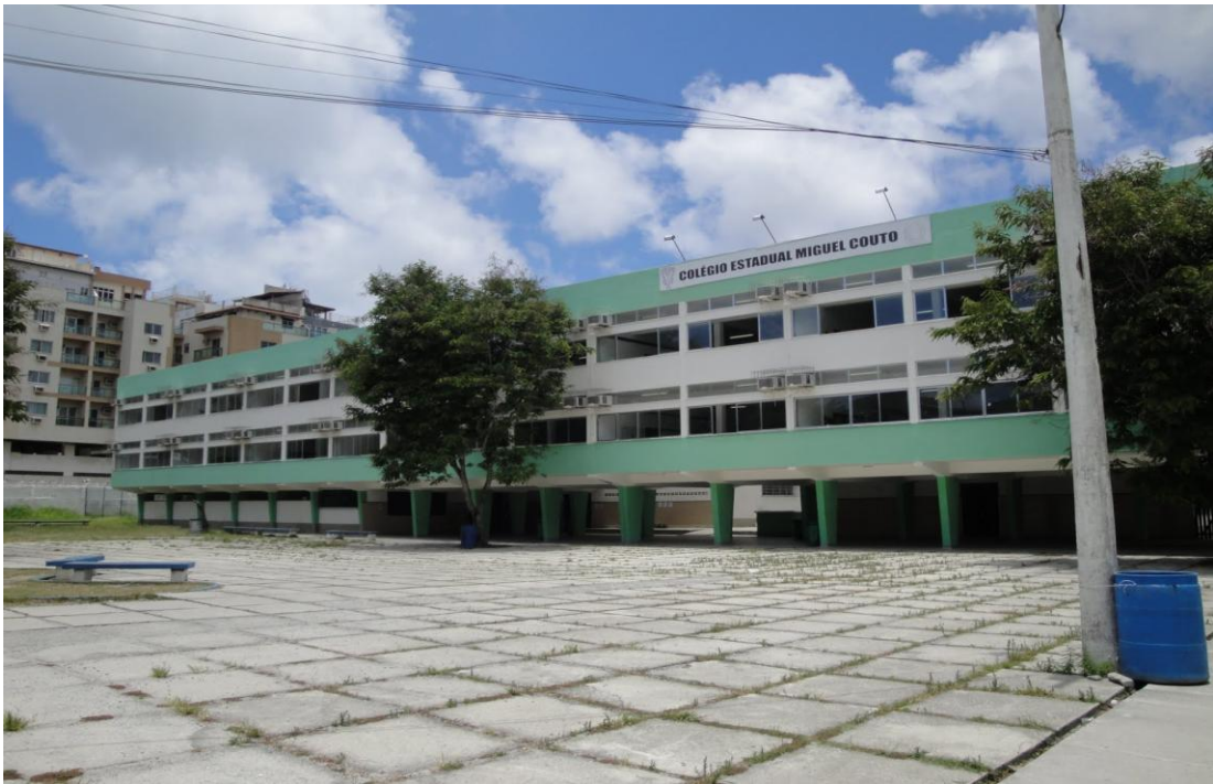
Escola Estadual Miguel Couto.