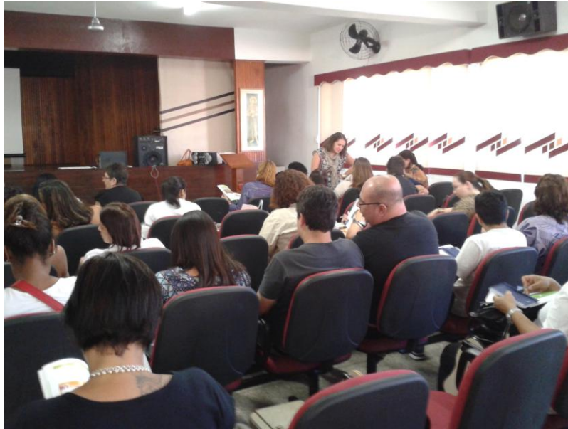
Encontro para escolha de livros pelos professores