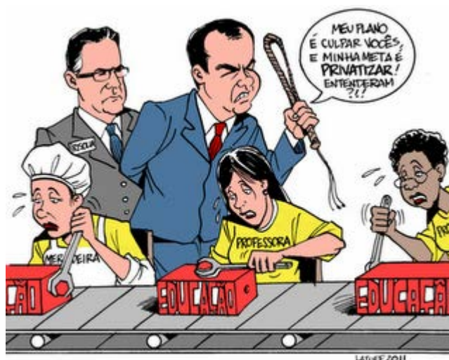
Figura 4 - Reforma carioca 16

Uma forte característica do neotecnismo pedagógico é o estreitamento curricular, em que a ênfase do ensino é feita nas disciplinas e competências que serão avaliadas nos testes, deixa se lado outras dimensões da matriz formativa, o compromisso de formar um sujeito completo, do trabalho para o desenvolvimento corporal, criativo, social e cultural. É como se uma “boa educação” para os mais pobres fosse apenas focar neste básico que é valorizado nos testes, formando um conjunto mínimo necessário de cognição e conhecimento básicos.