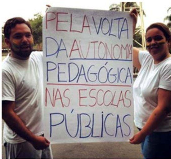
Figura 1 - Cartazes de manifestação 2

No Brasil os meses de junho e julho de 2013 foram marcados por diversas passeatas e protestos. Muitas pautas foram debatidas, combatidas e, até mesmo, esbravejadas. As questões ligadas à área da educação me despertaram maior interesse. Entre muitos pedidos por “escolas padrão FIFA” 1 e maior investimento na educação uma pauta me chamou atenção em especial: