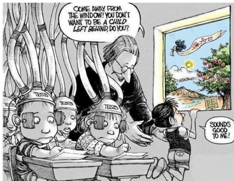
Figura 3 - Many Subjects not Included 14

Quanto ao combate da exclusão de alunos, nas metas atuais para a melhora da qualidade da educação brasileira, é possível notar diretrizes que estimulam a permanência dos alunos na escola tanto que, de fato, isso conta até mesmo para a nota do IDEB. As medidas para a garantia da permanência dos alunos na escola têm diversas formas, tais como: contrapartida exigida de famílias que participam de programas assistenciais, forma de bonificação e sanção para escolas dependendo do seu número e evasão e programas específicos para o combate da evasão; como é o caso do Programa Autonomia.