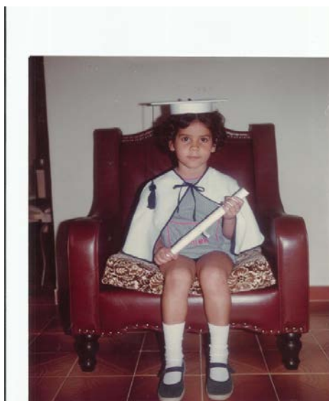
Legenda: Na Escola Municipal Adlai Stevenson - Dezembro de 1984.